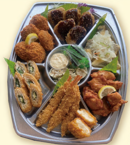
基本 (3~4人分) (税込 2,600円 ) (5~6人分) (税込 3,600円 )