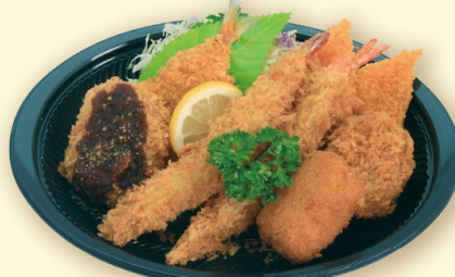
フライ盛り (税込 1,080円 )