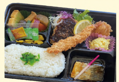
A59 特選幕之内 1,100円 (¥1,188円)