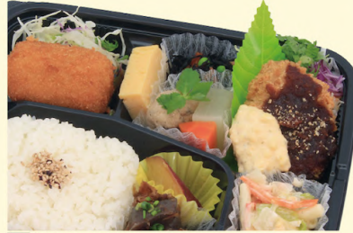
A57 野菜いっぱい ダブル幕之内 (2品選択) 741円 (¥800円)