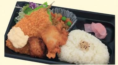
A58 プチ幕之内 メイン料理を幕の内同様お選び下さい。 454円 (¥490円)