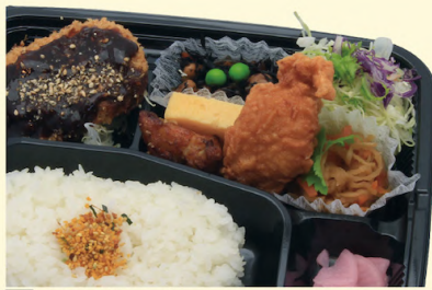
A54 メインが選べる 幕之内 (1品選択) 602円 (¥650円)