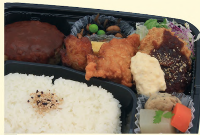
A55 メインが選べる ダブル幕之内 (2品選択) 741円 (¥800円)