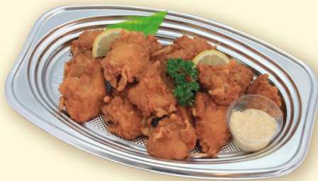
から揚げ (税込 1,080円 )