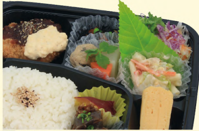
A56 野菜いっぱい 幕之内 (1品選択) 602円 (¥650円)